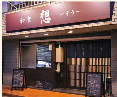
コースは1人3240円〜(4人以上、2日前までに予約が必要)。 また、天ぷらなど一部メニューは持ち帰りもOK。