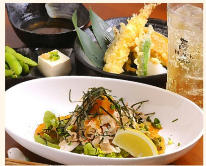
お得に飲むなら「チョイのみセット」1814円を。天ぷらなど料理 4品に、ドリンクは生ビール・ハイボール・サワーから1杯選べる。