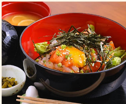
旬の魚介を3~4種類たっぷり載せた「海鮮お刺身ユッケ丼」 950円。とろ〜り黄身を絡ませれば一層贅沢な美味しさに。